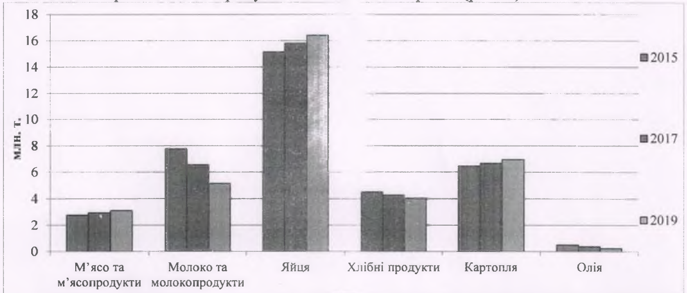
Рис. 2 Прогностні значення обсягів споживання продовольчої продукції населенням України протягом 2015-2019 рр.

За допомогою середньоквадратичної та середньої абсолютної помилки обрано оптимальні прогностні моделі трендів на основі яких розраховано майбутні обсяги споживання продовольчої продукції населенням України (рис. 2).