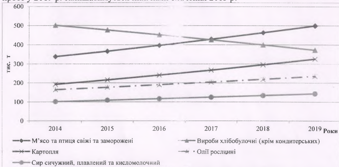
Рис. 2 Прогноз річних обсягів продажу продовольчої продукції у торговельних мережах України на період до 2020 р., тис. т

На основі адаптивної прогнозної моделі (1) та прогнозних значень факторних ознак побудовано прогноз річних обсягів продажу продовольчої продукції на період до 2020 р. (табл. 4), який засвідчує про можливе зростання у 2019 р. порівняно з 2013 р. обсягів реалізації картоплі на 82 %, плодів, ягід, винограду, горіхів, кавунів та динь – на 97 %, овочів – на 100 %, олії – на 63 %, яєць – на 50 %, свіжого та замороженого м'яса – на 50 %, сиру – на 48 %, морозива – на 38 %, готових рибних продуктів – на 33 %. Як очікується, доволі низькими темпами зростатиме реалізація копченого, солоного м'яса, готових м'ясних продуктів, риби й морепродуктів, кондитерських виробів, борошна, круп і бобових. Обсяги реалізації вершкового масла практично не зміняться, а обсяги купівлі цукру, хоч і будуть поволі зростати проте у 2019 р. залишатимуться нижчими значення 2013 р.