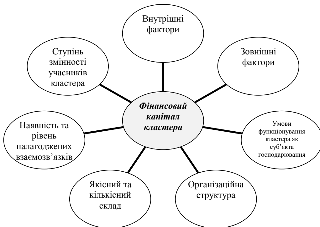
Рис.1. Особливості формування фінансового капіталу кластерів

угоди, андеррайтинг) та залучені джерела (субвенції та державне інвестування, кошти регіональних і місцевих організацій сприяння економічного розвитку, кошти міжнародних цільових фондів, кошти венчурних фондів, «бізнес-ангелів», інша безоплатна фінансова допомога).