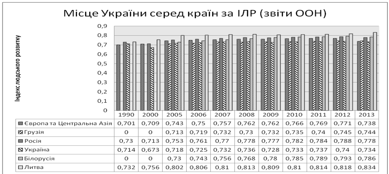
Рис 2. Індекс розвитку людського потенціалу 2014 р. (рейтинг України)

Позитивний вплив на формування ІР та їх активне використання у відтворювальному процесі матиме створення при інститутах інноваційних підприємств і центрів трансферу наукових ідей, технологій, що підвищить інтелектуальний рівень фахівців за допомогою залучення в освітній процес нового унікального обладнання, формування інтересу до творчості та новаторства.