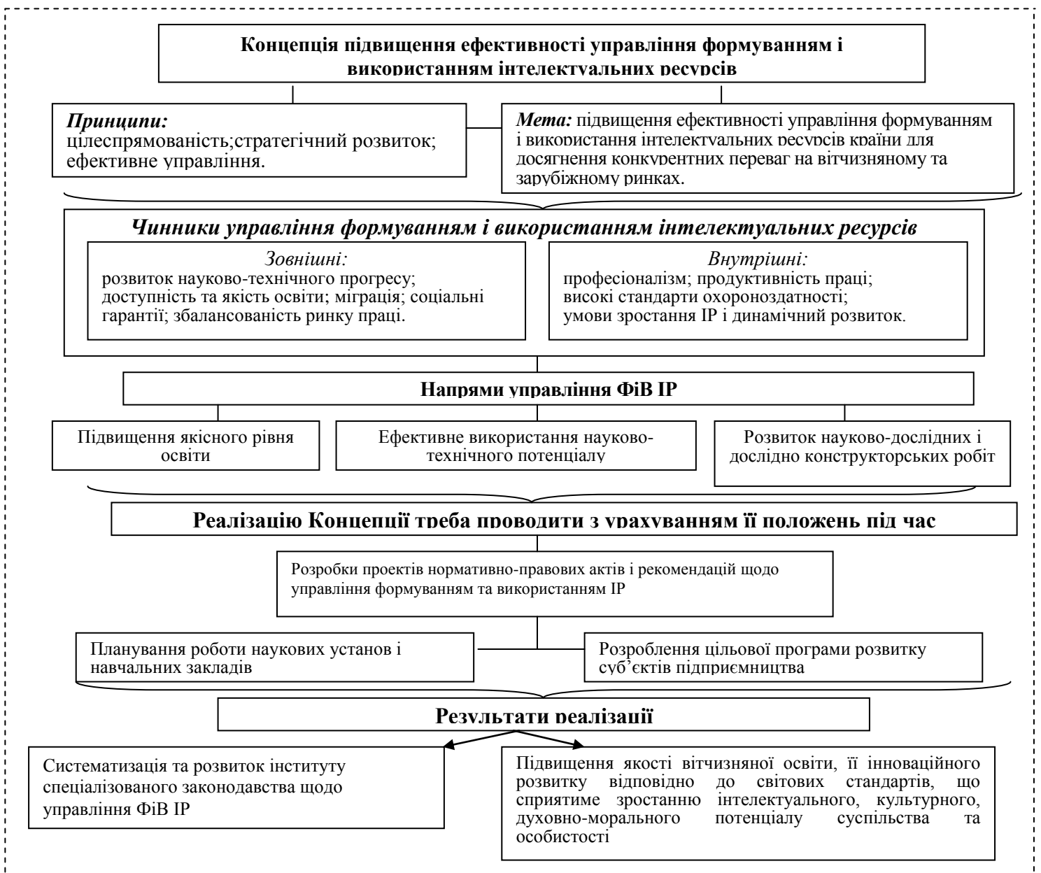
Рис. 4. Концепція управління формуванням і використанням ІР в Україні

Розроблено концепцію поліпшення управління формуванням і використанням ІР, яка визначає: мету, основні принципи державної політики та чинники щодо управління ФіВ інтелектуальних ресурсів, її напрями, очікувані результати (рис. 4).