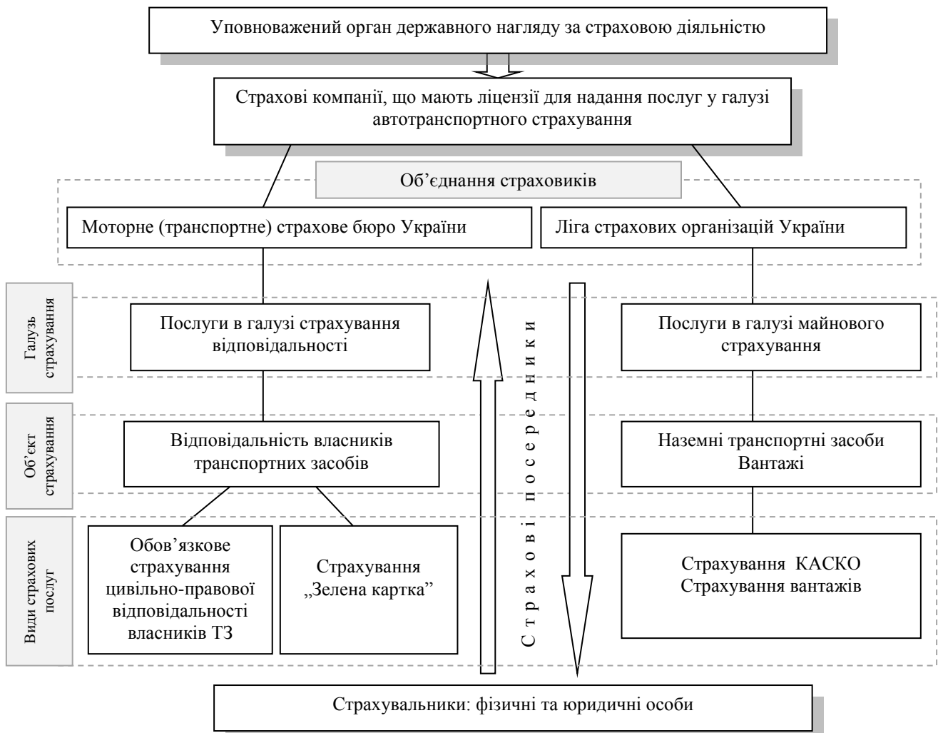
Рис. 1. Взаємодія суб'єктів і об'єктів на ринку автотранспортного страхування

страхування зумовлює часткове поєднання ризиків, їх акумуляцію в межах окремих страхових продуктів.