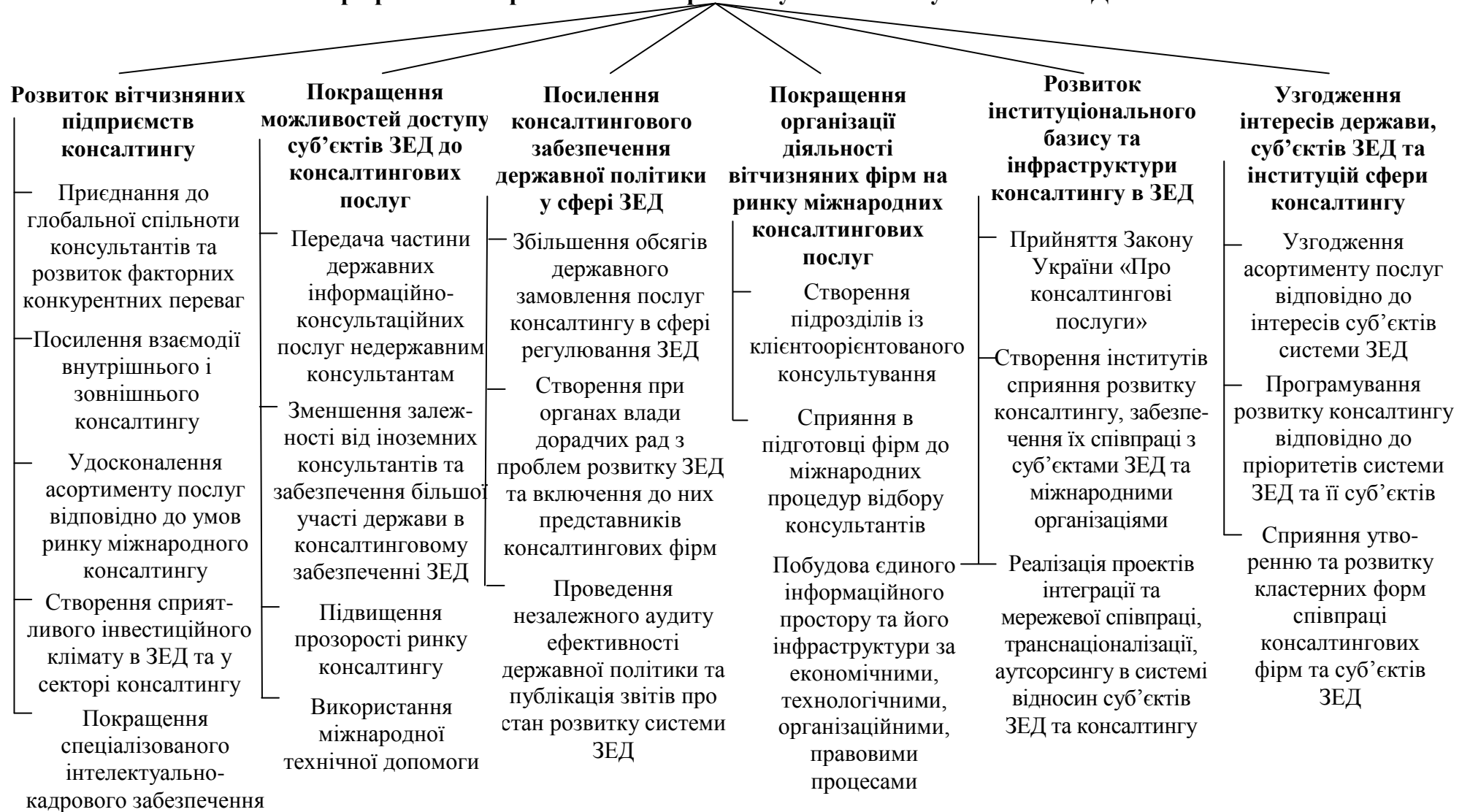
Рис. 5. Пріоритети та засоби розвитку послуг консалтингу в системі зовнішньоекономічної діяльності України