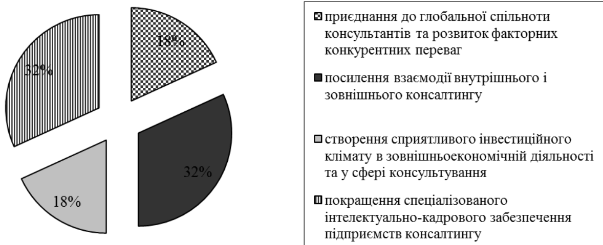
Рис. 3. Структура найбільш перспективних засобів розвитку вітчизняних підприємств консалтингу

обґрунтуванню стратегічних орієнтирів, механізмів та засобів, а також визначенню головних шляхів удосконалення інституційного середовища розвитку послуг консалтингу в системі зовнішньоекономічної діяльності України.