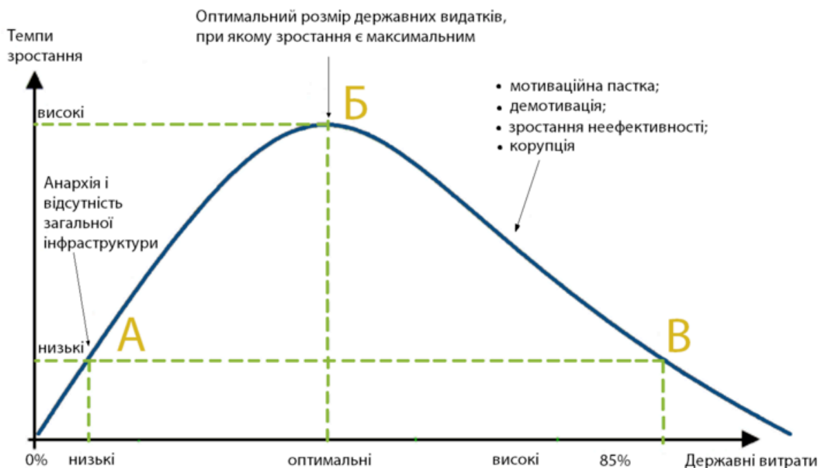
Рис.2. Крива Армея – взаємозв'язок між рівнем перерозподілу ВВП через державний бюджет і економічним зростанням

Оптимальне співвідношення між державним і приватним секторами є одним із найважливіших питань сучасної економіки. Проведений аналіз засвідчує, що коли державний сектор недостатній, його фізичних можливостей не вистачає на базову безпеку та захист прав власності. Це негативно позначається на інвестиційному кліматі й відповідно – на економічному зростанні. Американський економіст Річард Армей концепцію оптимального розміру державного сектора зобразив графічно у вигляді перевернутої латинської літери U (рис. 2.).