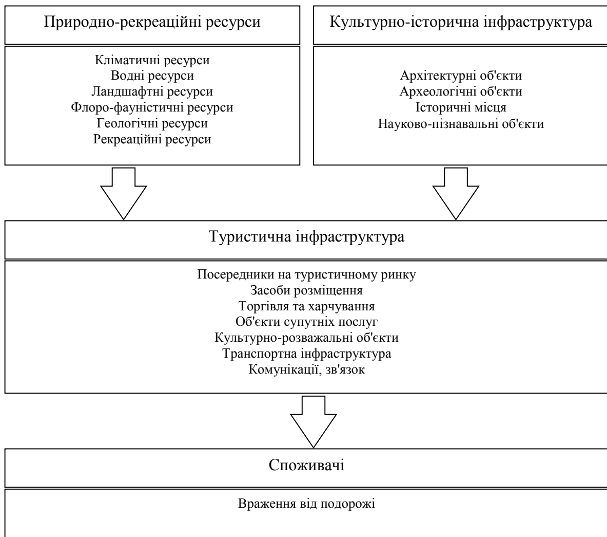
Рис. 2. Місце туристичної інфраструктури в індустрії вражень*

Обґрунтовано, що рівень конкурентоспроможності туристичного кластера істотно впливає туристична інфраструктура. Вона займає місце проміжної ланки між наявними в регіоні природно-рекреаційними ресурсами, культурно-історичною інфраструктурою та задоволенням потреб споживачів у рамках діяльності індустрії вражень. Мають місце розбіжності щодо віднесення тієї чи іншої складової до поняття туристичної інфраструктури або до інших компонентів конкурентоспроможності туризму. За позицією Світового економічного форуму складова охорони здоров'я належить до субіндексу правового регулювання в туризмі та подорожах. Аналіз параметрів туристичної інфраструктури та її місце в індустрії вражень показано на рис. 2.