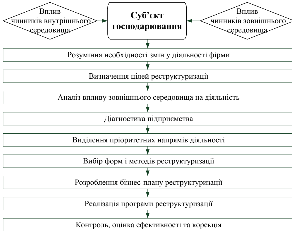
Рис. 2. Модель реструктуризації суб'єкта господарювання

До основних заходів фінансової реструктуризації належать реструктуризація заборгованості перед кредиторами; одержання додаткових кредитів; збільшення статутного капіталу; заморожування інвестиційних вкладень та соціальних проектів.