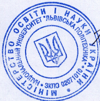
Р. Б. Брилинський

Відгуки надійшли до спеціалізованої комісії 15.03.2017 р. Вчений секретар [Signature] / [Signature] С.І./