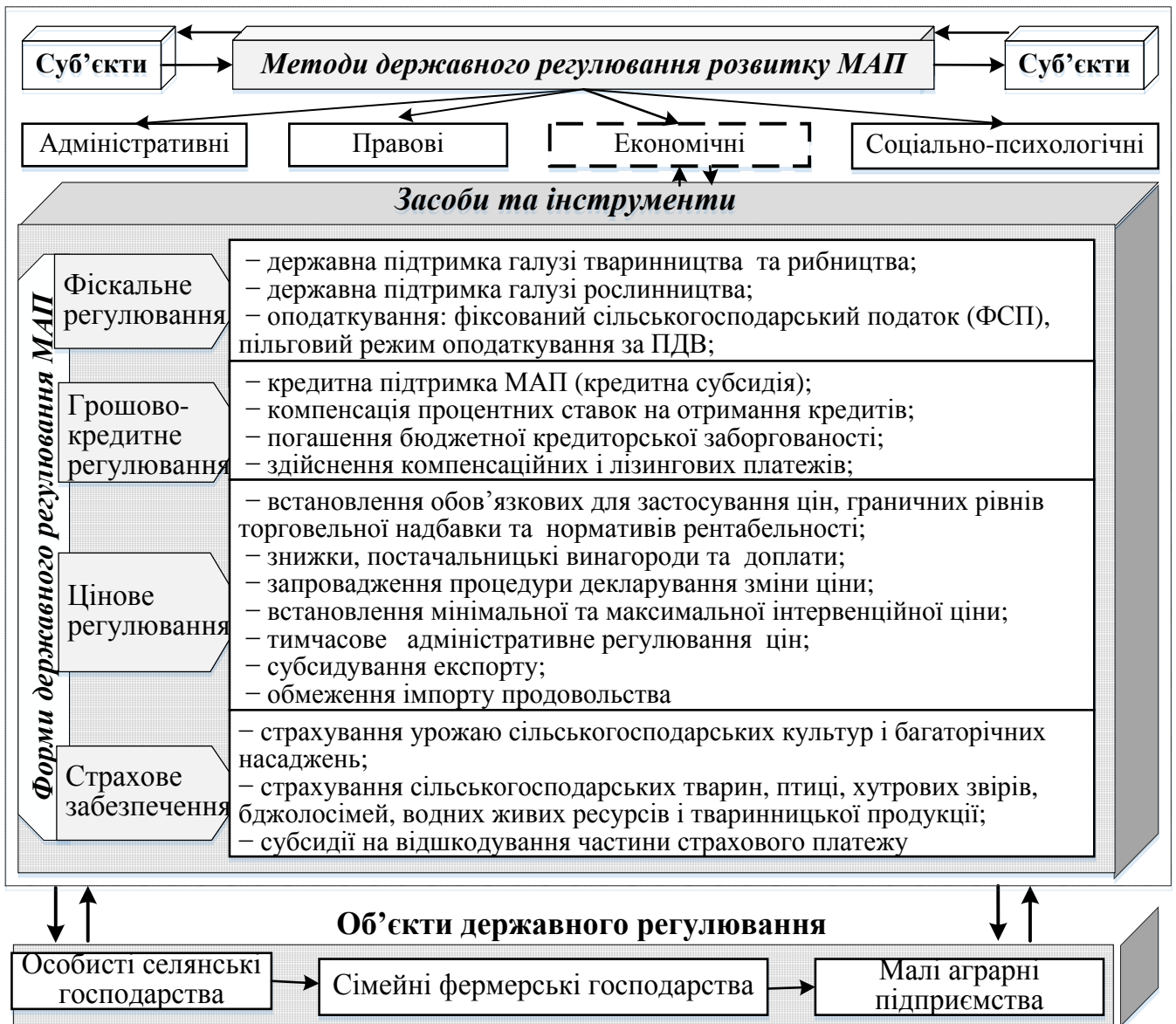
Рис. 1. Механізм державного регулювання розвитку малого аграрного підприємництва в Україні