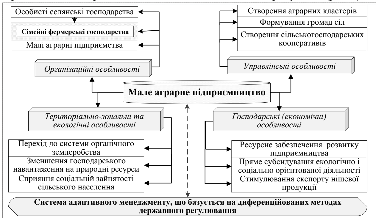
Рис.4. Концептуальні засади адаптивної моделі державного регулювання розвитку малого аграрного підприємництва в Україні

Значна диференціація Індексу успішності діяльності малих фермерських господарств зумовлює необхідність формування якісно нової системи адаптивного державного менеджменту в аграрній сфері України. Дисертантом визначено адаптивний державний менеджмент розвитку МАП як систему заходів держави, що базується на диференційованому підході до здійснення регулюючих механізмів підтримки суб'єктів МАП, виходячи з інтегральної оцінки їх успішності та формування на основі цього послідовних етапів його реалізації у відповідності до економічних, екологічних та соціальних цілей їх розвитку. Визначені концептуальні засади адаптивної моделі державного регулювання розвитку МАП в Україні спрямовані на підсилення складових успішної діяльності малих аграрних підприємств, а саме розвитку кооперативних відносин з подальшим інтегруванням в агропромислові кластерні об'єднання екологосоціального спрямування (рис. 4).