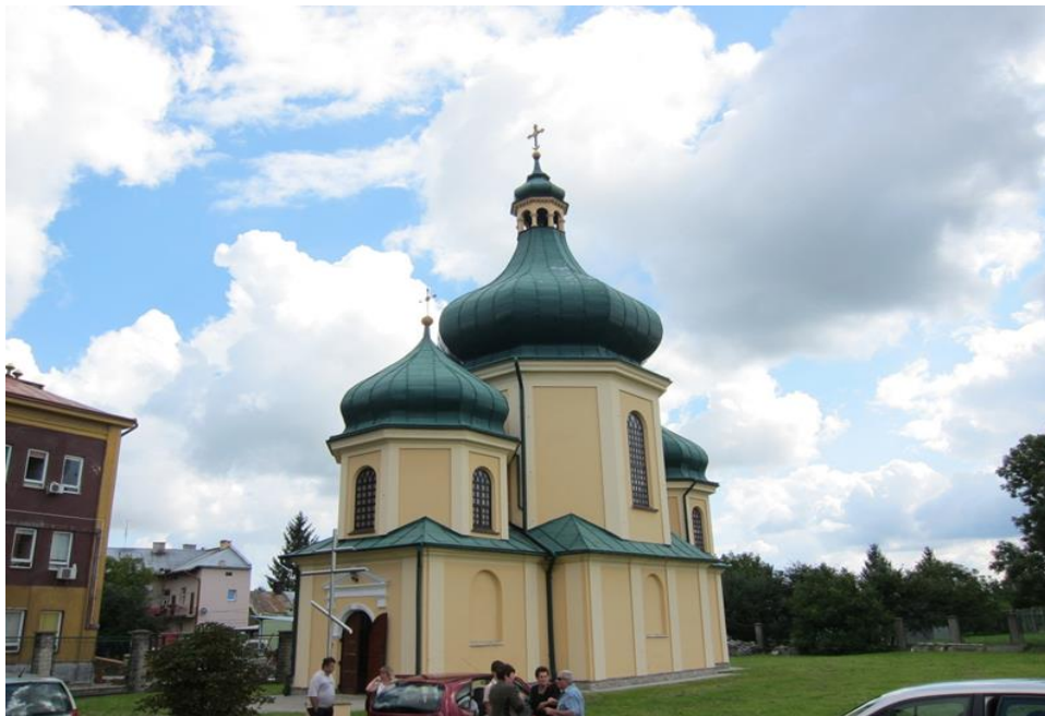
Православна церква Різдва Пресвятої Богородиці (гарнізонний храм) м. Перемишль.