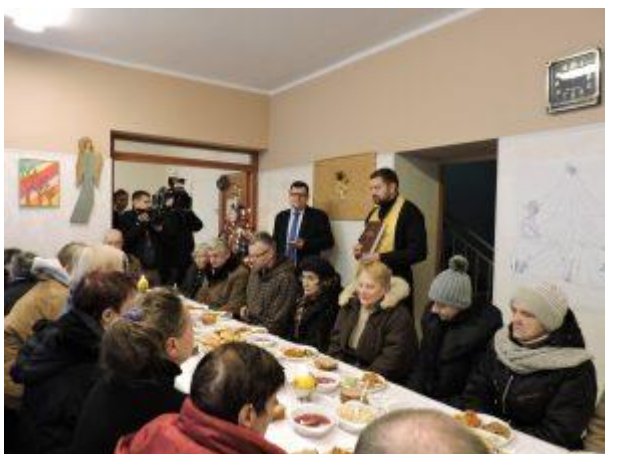
Великодній сніданок та різдвяна вечеря для безпритульних у м. Білосток (2015 р.)