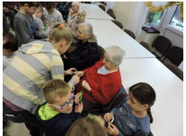
Візит до Будинку для літніх людей св. Пророка Іллі в м. Білосток (2016 р.)