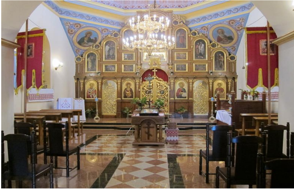
Православна церква Різдва Пресвятої Богородиці (гарнізонний храм) м. Перемишль. Внутрішній інтер'єр.