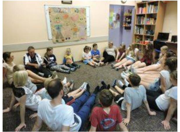
Проект організації «Елеос» для дітей «Родинна зустріч» (2016 р.)