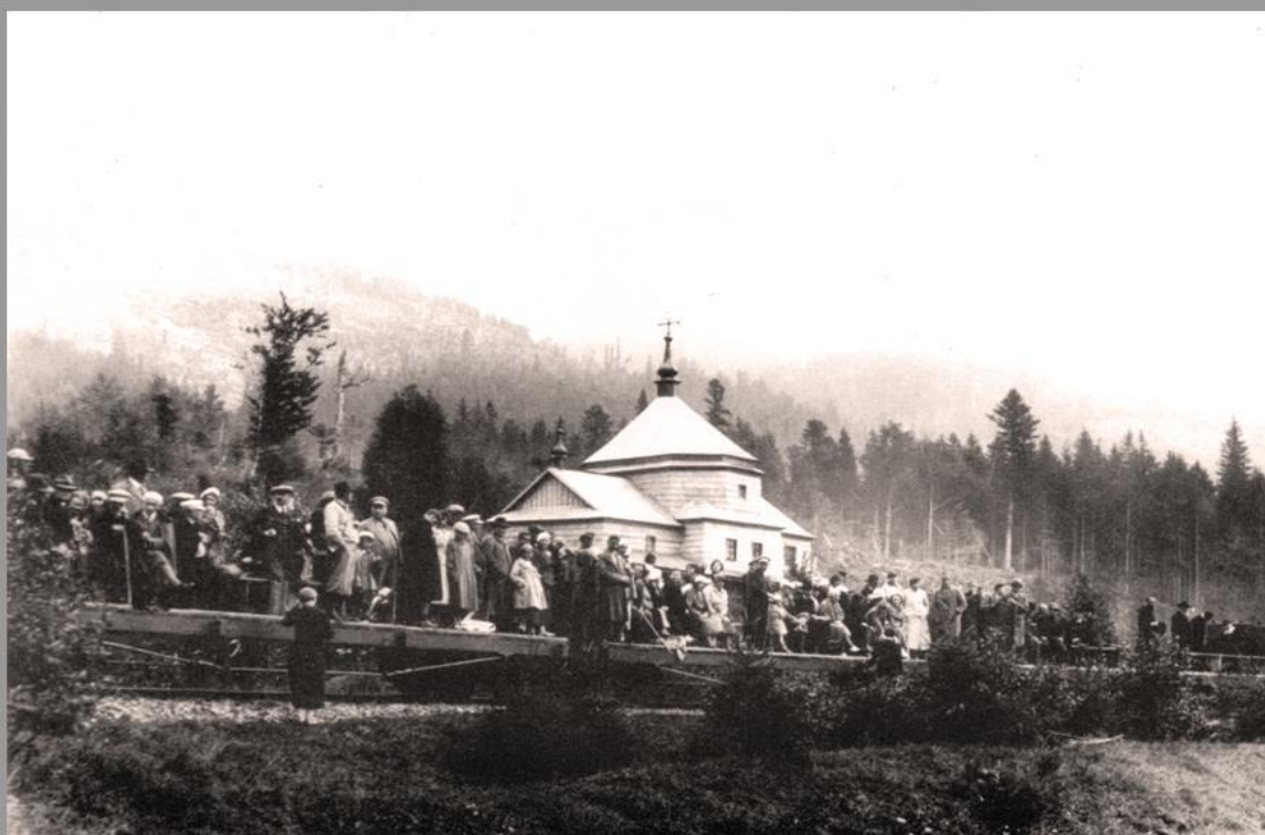
Монастирська церква в с. Лужках (поблизу с. Підлютого). Митрополит із духовнством та відпочивальниками очікують на відправлення поїзда