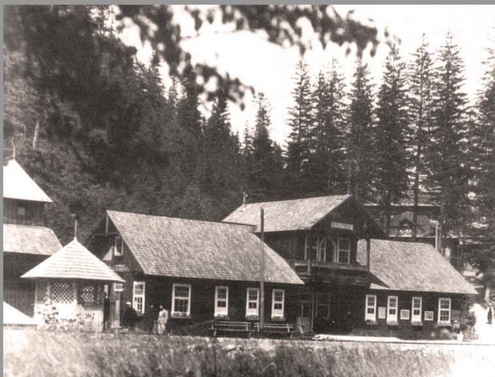
с. Підлюте. Лазня, газетний кіоск, на другому плані -- «Кедрова палата». Станція вузькоколійки