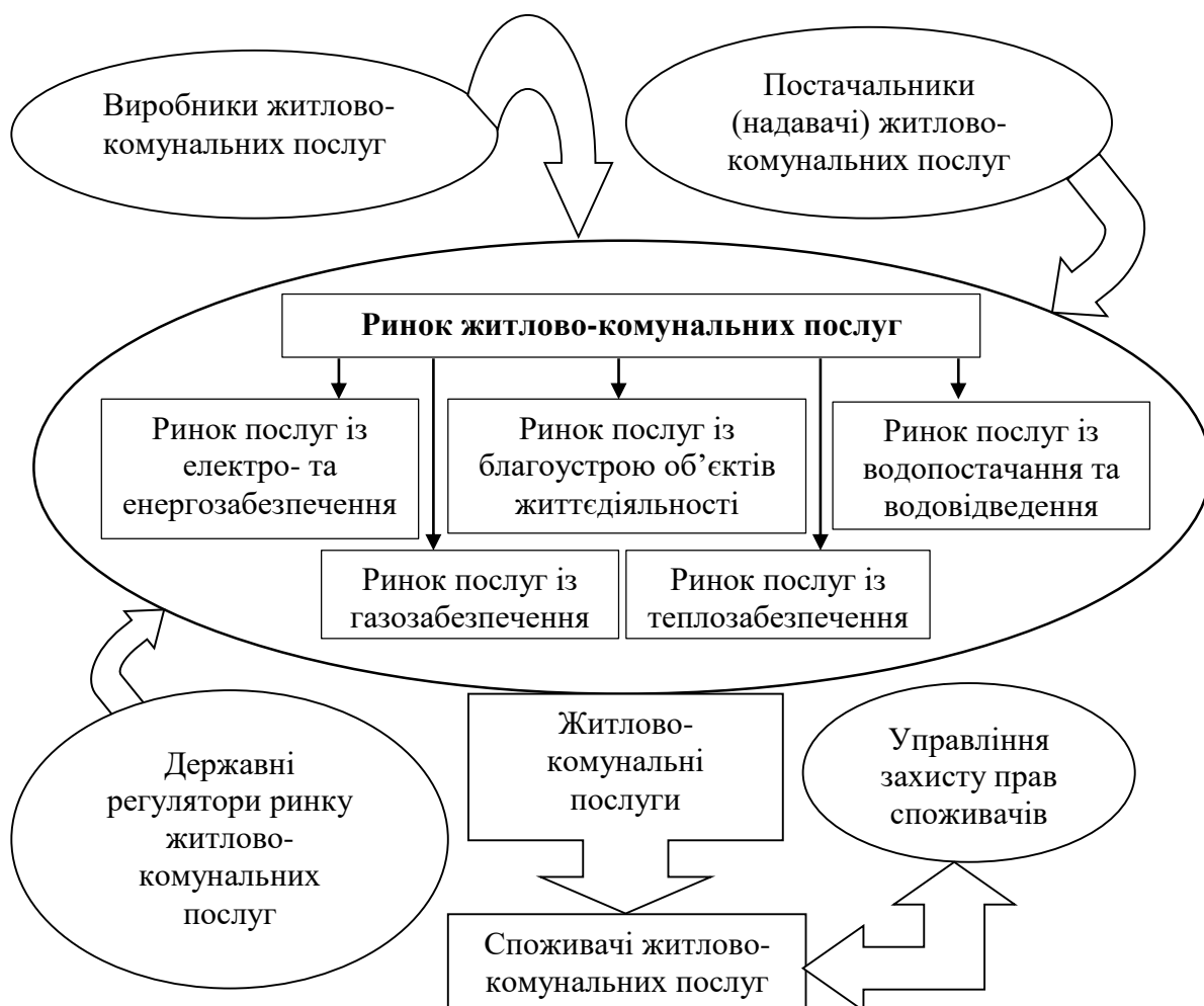
Рис. 1. Структура ринку житлово-комунальних послуг

Обґрунтовано доцільність тлумачення РЖКП як складної соціально-економічної системи взаємодії виробників та споживачів таких послуг, що передбачає дотримання правових норм, визначення обґрунтованої ціни та потреби в обсязі послуг, забезпечення взаємозалежності прав споживачів із якістю надання житлово-комунальних послуг. Автором доведено, що для ефективного функціонування, РЖКП має бути забезпечений: антимонопольним законодавством, системою економічного, правового та адміністративного регулювання з боку держави, конкурентними умовами, доступністю інформації про ринок, його структуру подано на рис.1.