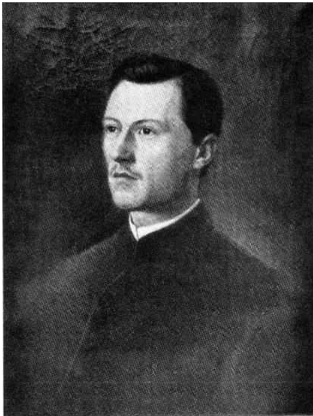
Портрет Т. Реваковича. 1868. Олія.

Рис. А. 5. Тит Ревакович (1814–1904 рр.)