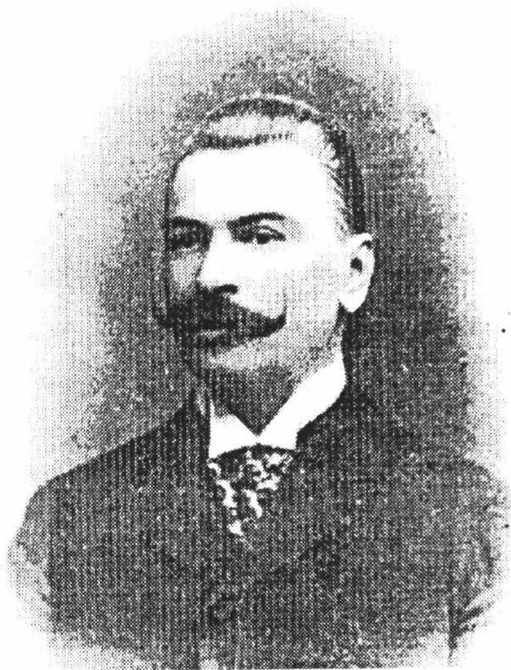
Рис. А. 3. Кирило Студинський (1868–1941 рр.)