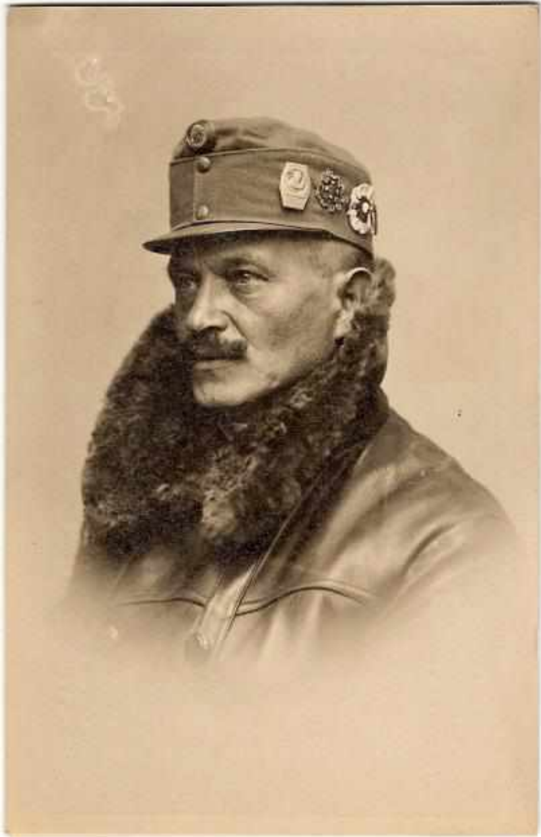
Рис. А. 8. Сень Горук (1873–1920 гг.)