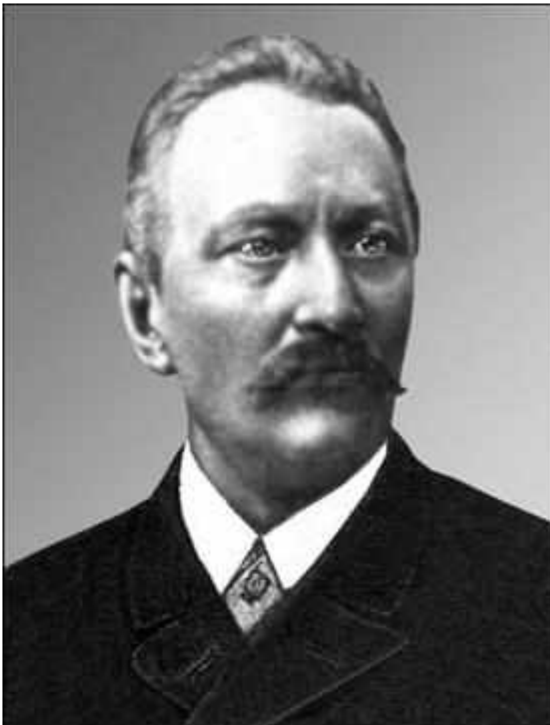
Рис. А. 2. Анатолий Вахнянин (1841–1908 гг.)