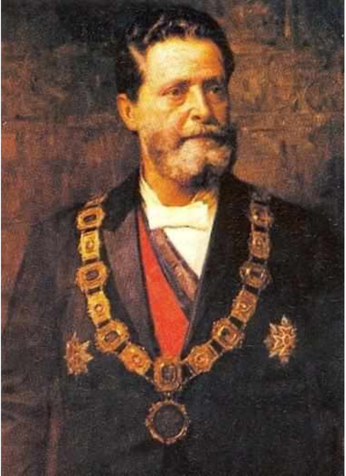
Рис. А. 12. Карл Люгер (1844–1910 гг.)