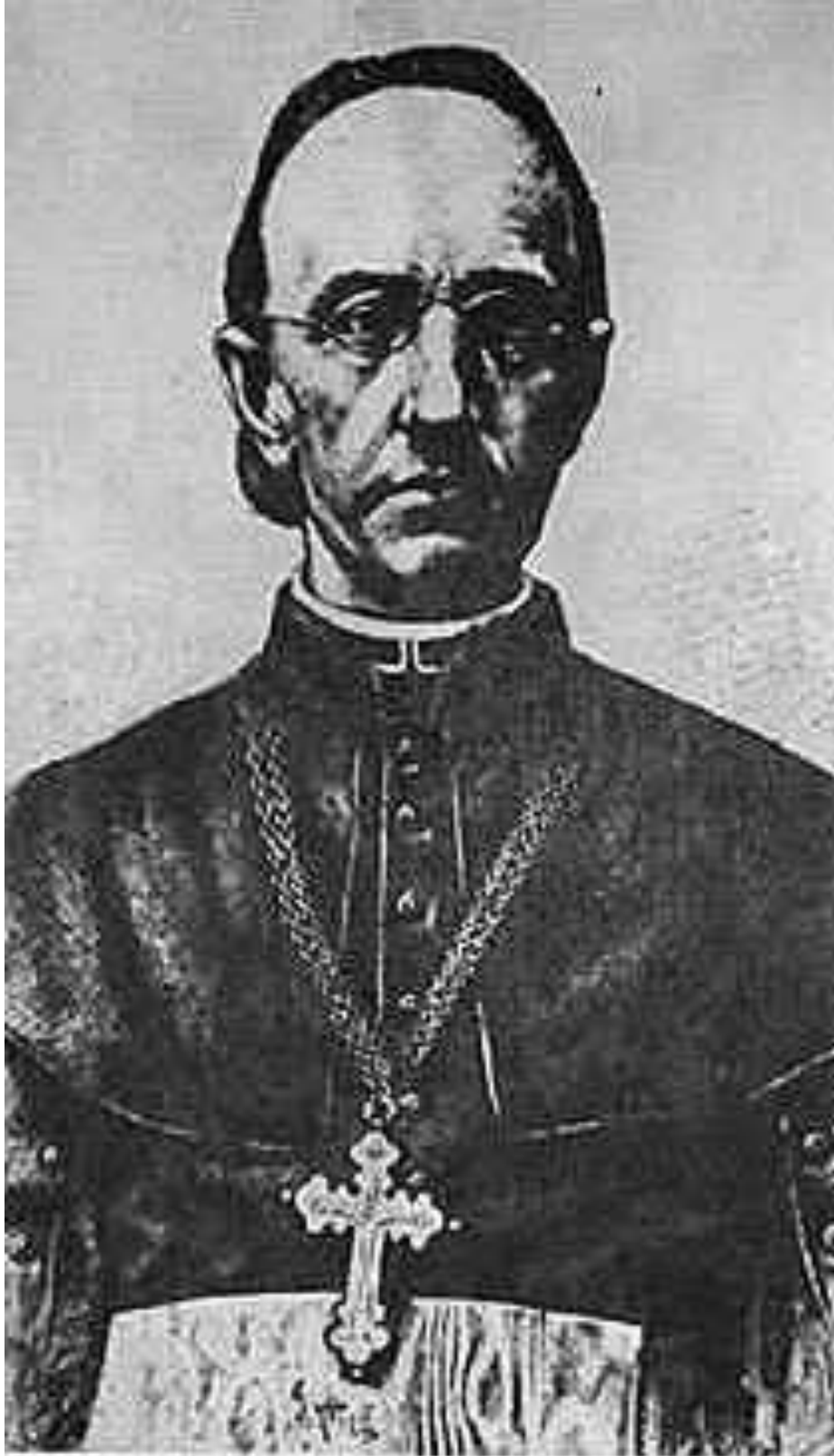
Рис. А. 4. Митрополит Сильвестр Сембратович (1836–1898 гг.)