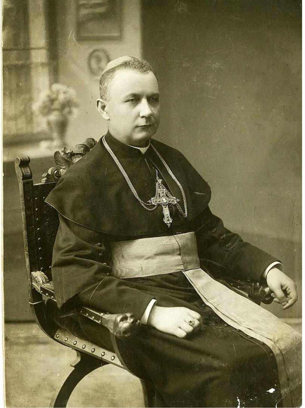
Рис. А. 6. Єпископ Григорій Хомишин (1867–1945 рр.)