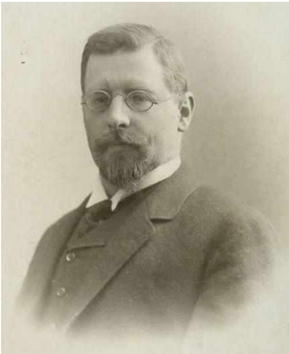
Рис. А. 11. Иван Шуштершич (1863–1925 гг.)