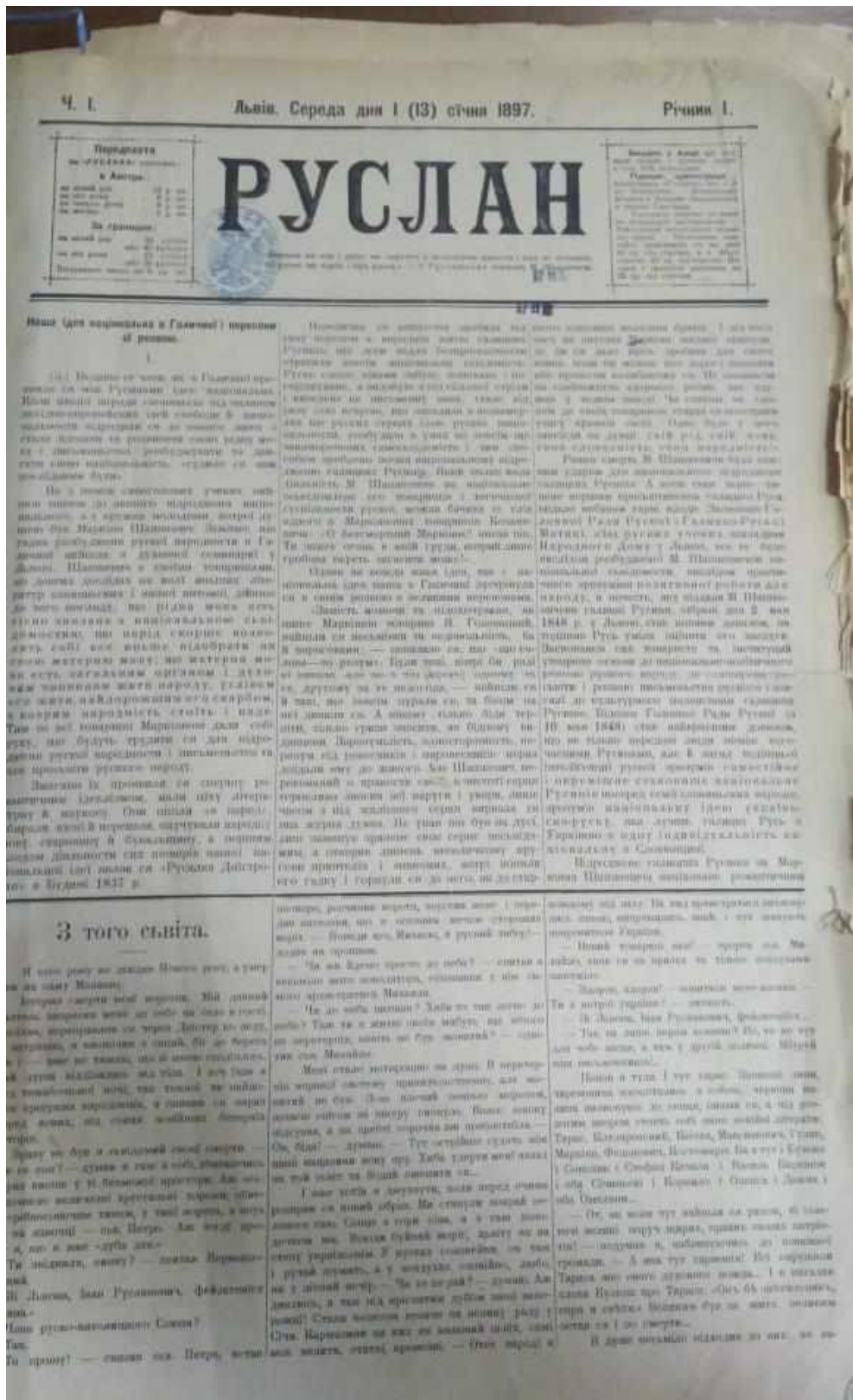
Рис. А. 15. Титульний аркуш часопису «Руслан»