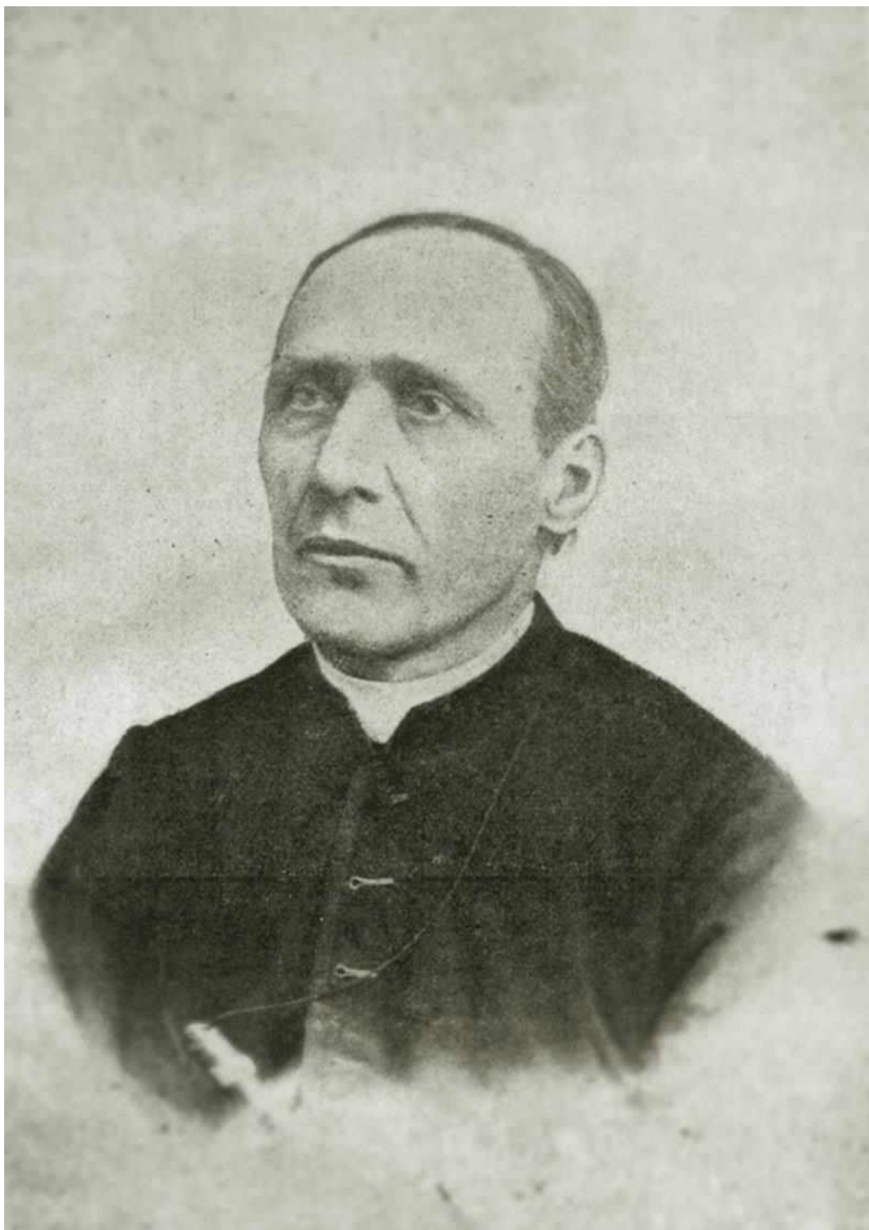
Рис. А. 13. Станіслав Стояловський (1845–1911 рр.)