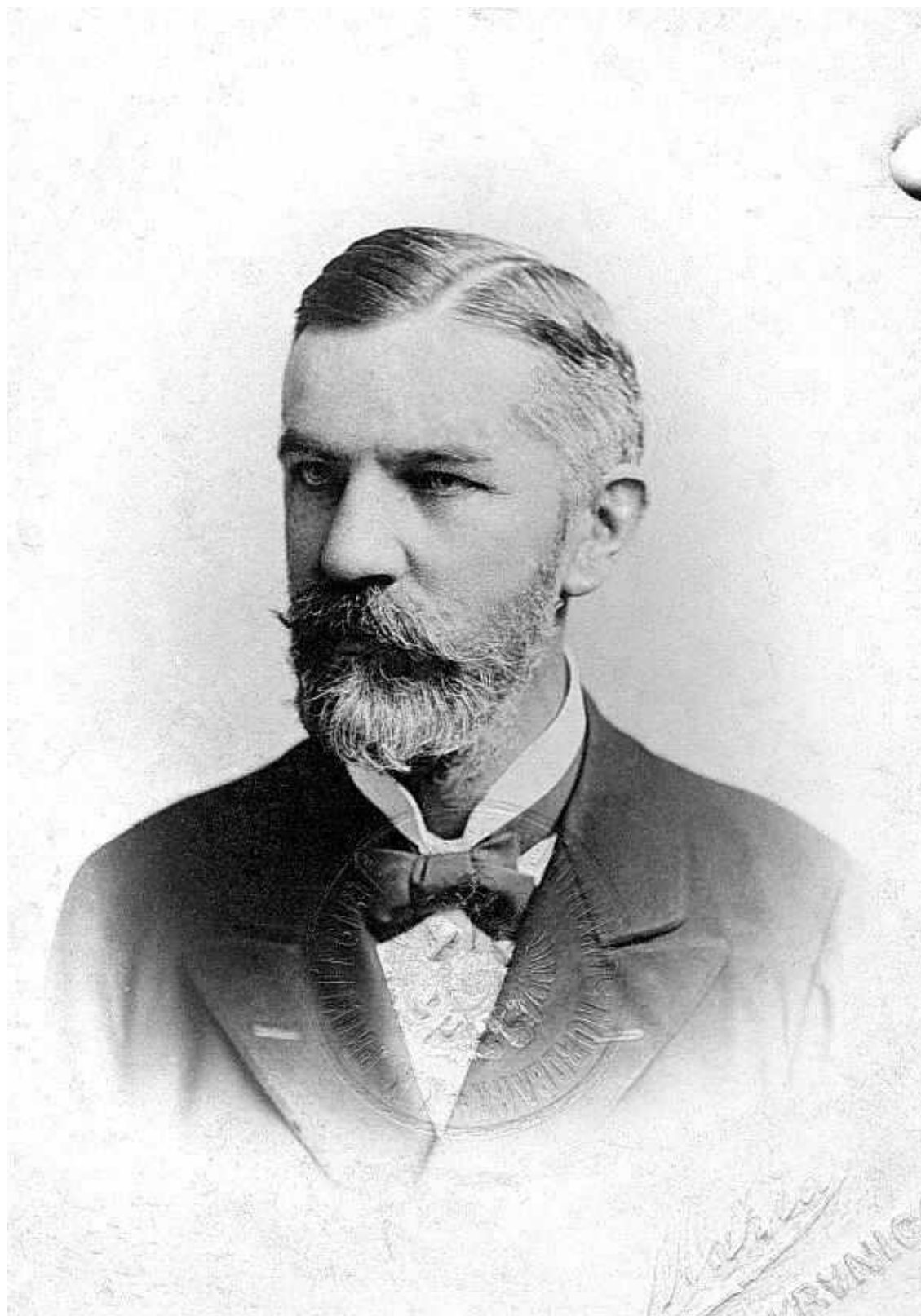
Рис. А. 1. Олександр Барвінський (1847–1926 рр.)