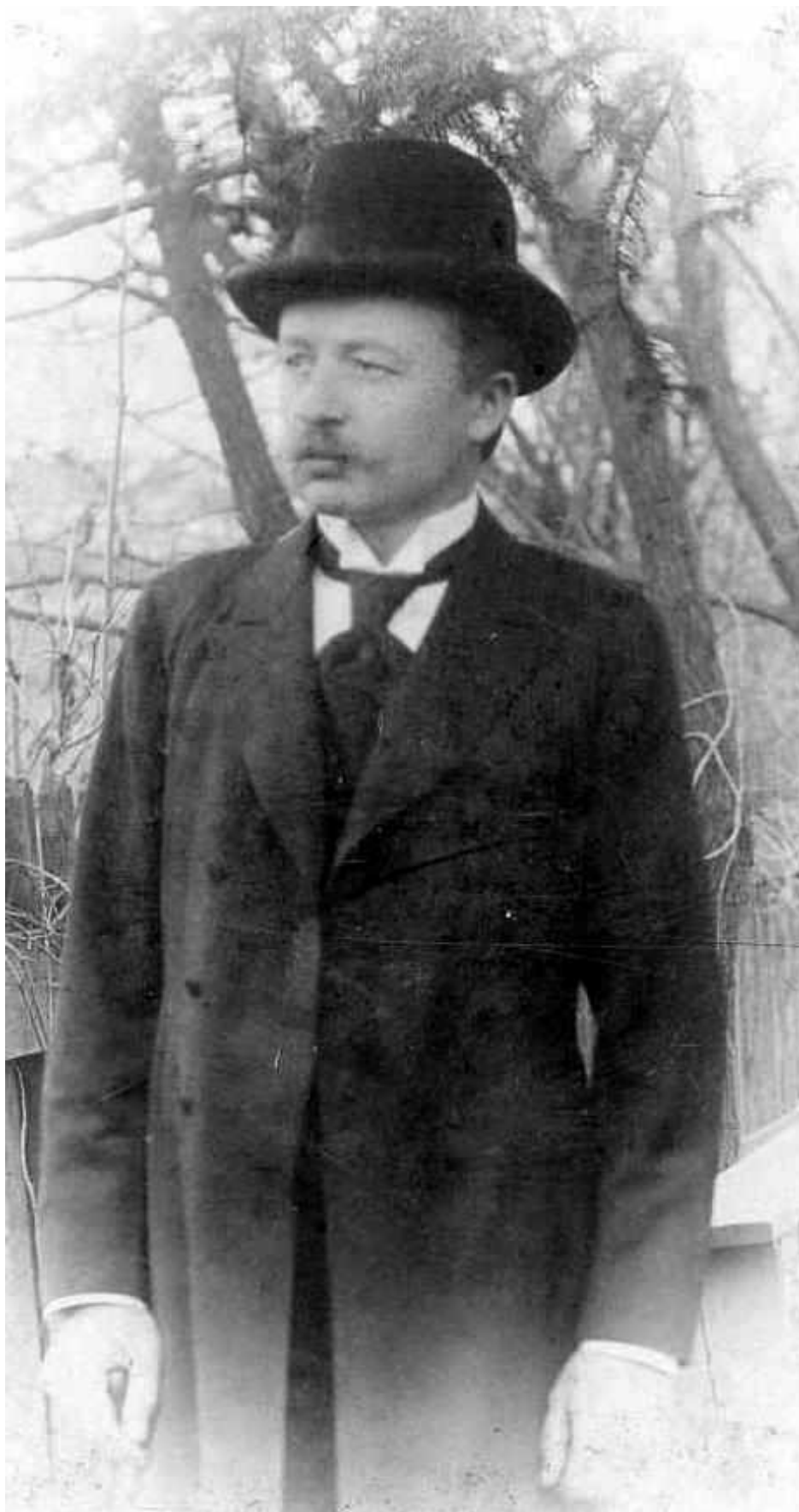
Рис. А. 9. Осип Маковей (1867–1925 рр.)