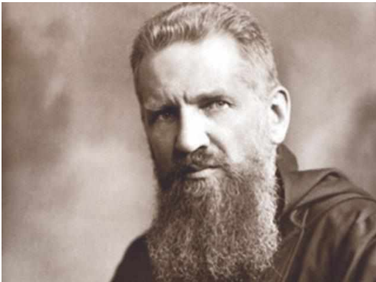
Рис. А. 7. Митрополит Андрей Шептицький (1865–1944 рр.)