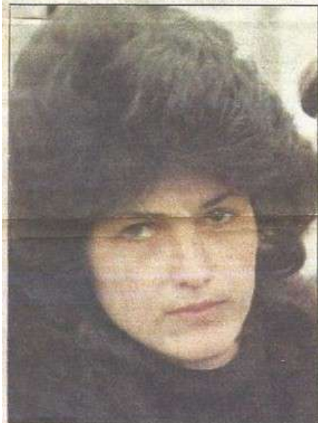
Kırım Türklerinin kadın lideri