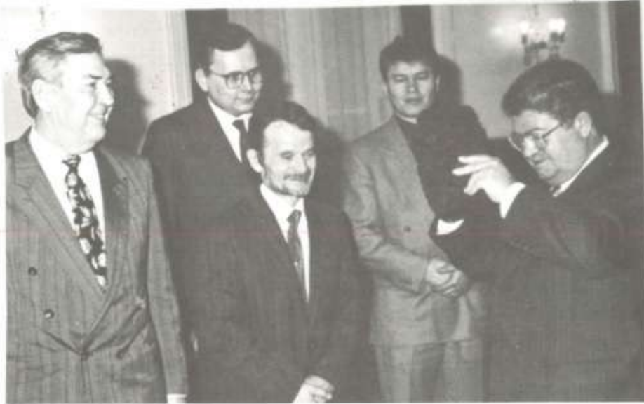
Kırımoglu ve Cumhurbaşkanı Turgut Özal

Зустріч кримської делегації на чолі з Головою МКН М. Джемільєвим з Президентом Турецької Республіки Т. Озалом, Анкара, лютий 1992 р.