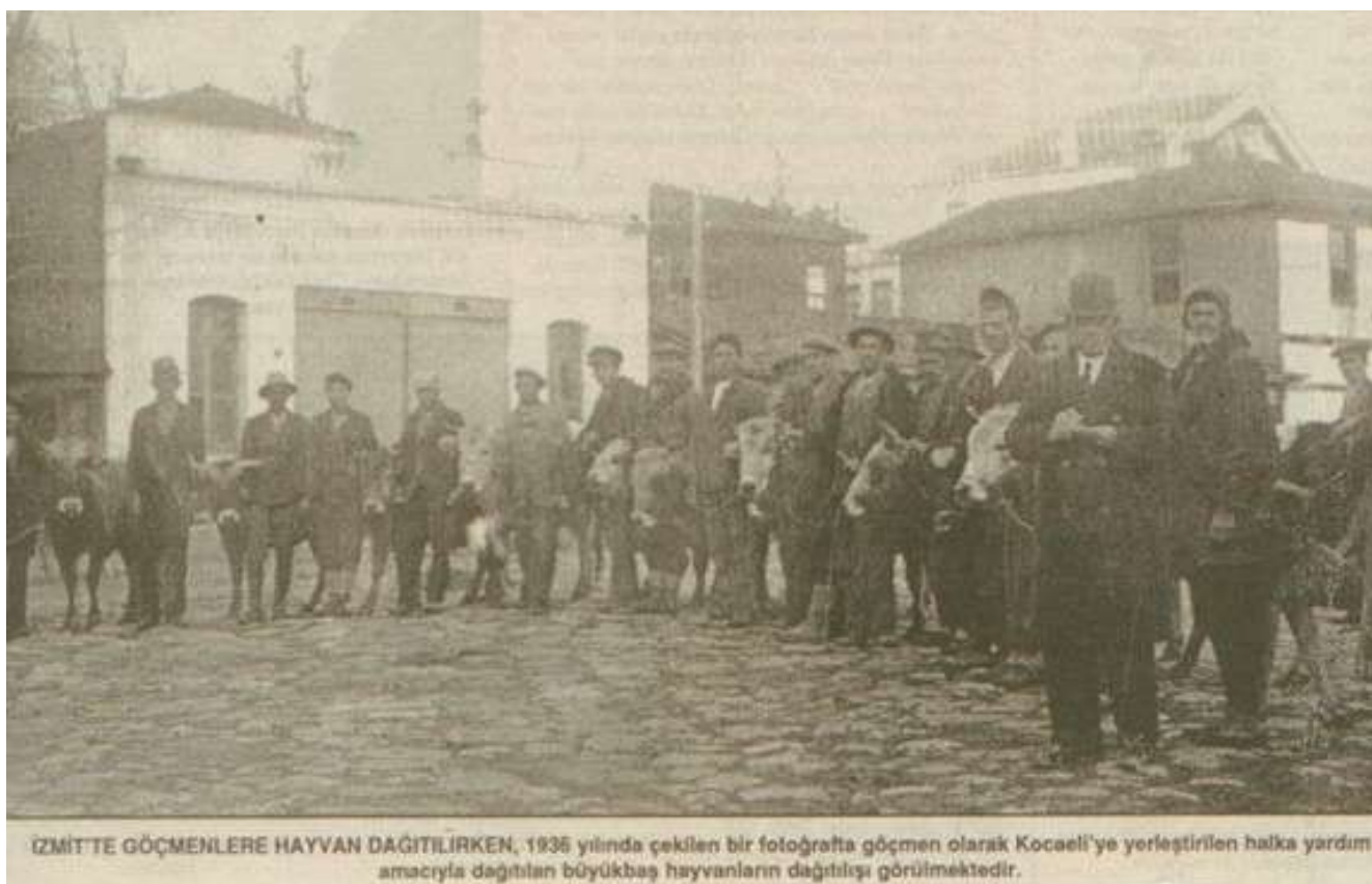
Роздача худоби переселенцям з Румунії в Ізміті. 1936 р.