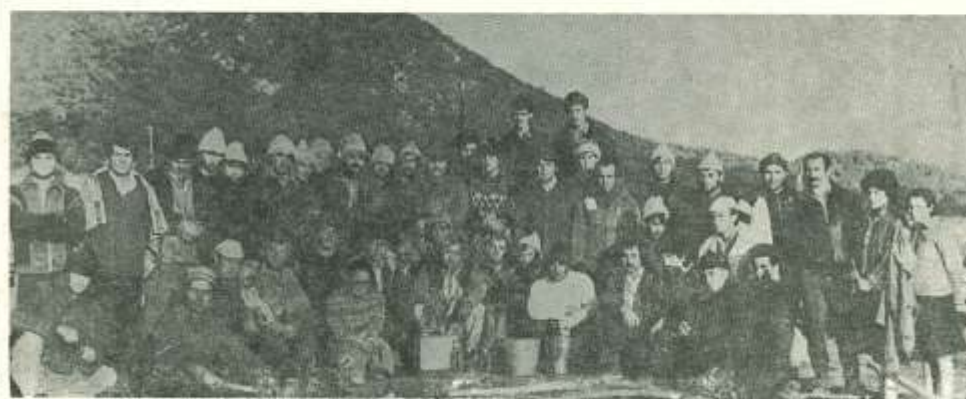
Фото наметового містечка «Asret» (Туга), м. Судак. Emel. № 175. Листопад-Грудень, 1989. Задня обкладинка.

"Vatan Kırım'da bu yıl içinde kurulan Kırım Tatar çadır şehirlerinden Hasret Köy'ün kurucularının 14 Ekim 1989 günü çektiikleri toplu fotoğraf. Çoğunluğu sürgünde doğmuş gençler. Milis'in ve özel zırhlı birliklerin baskın ihtimaline karşı ellerinde sopa benzin şişeleri. Vatan için her an ölüme hazır. Kışın soğukunda, dayanılmaz ayazında, 'Vatan toprağı ısıtır'diye, yer altında, derme çatma barakalarda varolma mücadelesi veriyorlar."