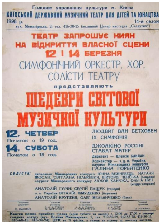
Рис.5. Афіша першого концерту на власній сцені. 1998 рік.