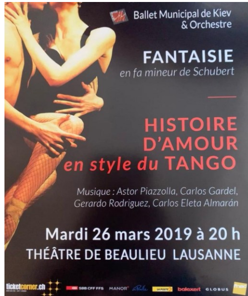
Рис. 13. Афіша гастрольного туру театру з виставою «Історії у стилі танго». 2019 рік.