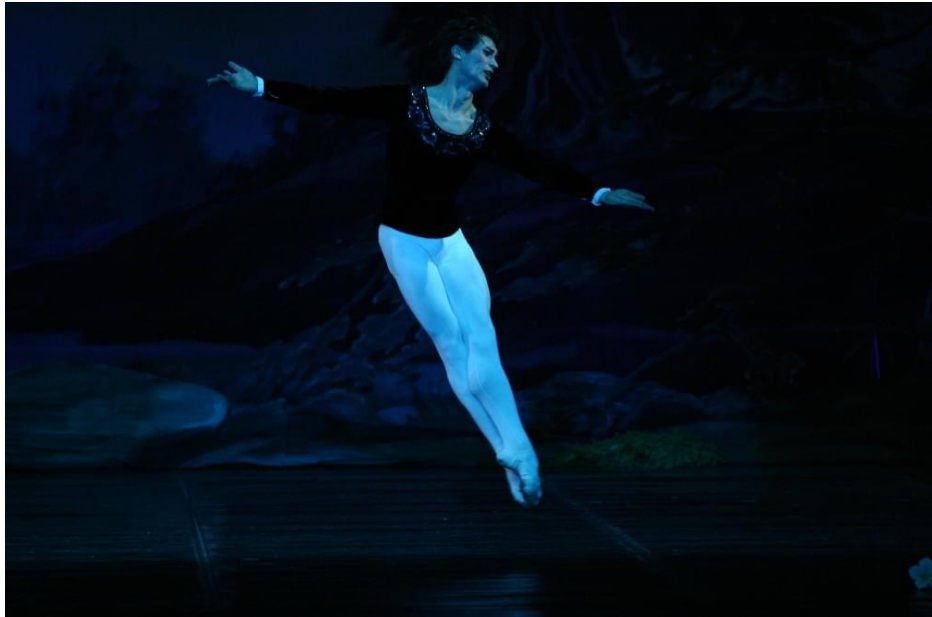
Рис. 7. Фото з балету «Жізель». Альберт К. Вінової. 2012 рік.