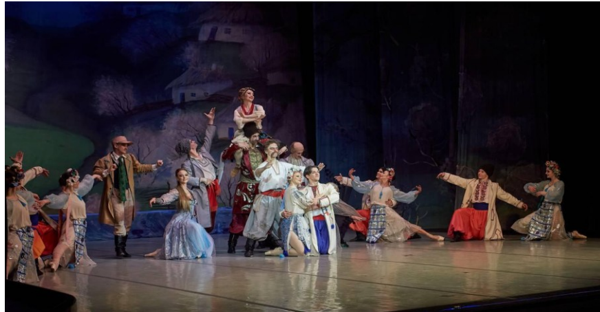
Рис. 15. Фото з вистави «Майська ніч». 2024 рік.